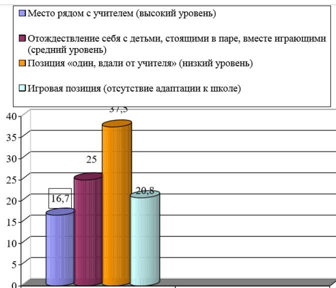
Рис.2.2 - Результаты определения уровней адаптации детей к школе на констатирующем этапе

Таким образом, детей с «низким уровнем адаптации к школе» и детей «отсутствием адаптации к школе», были разделены на 2 группы по 7 человек: экспериментальная группа, принявшая участие в развивающей программе и контрольная группа. Список учащихся представлен в (приложении 1).